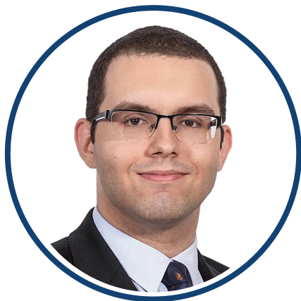
Piotr Mazurek pełnomocnik rządu ds. polityki młodzieżowej